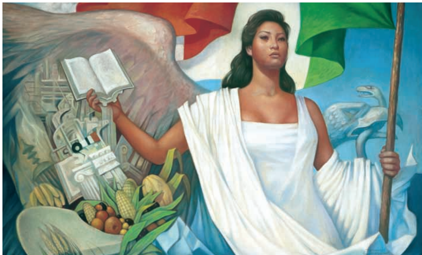
La Patria (1962), Jorge González Camarena

Esta obra ilustró la portada de los primeros libros de texto. Hoy la reproducimos aquí para que tengas presente que lo que entonces era una aspiración, que los libros de texto estuvieran entre los legados que la Patria deja a sus hijas y sus hijos, es hoy una meta cumplida.